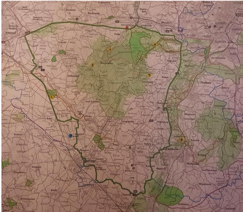
Abb. 2: Ergebniskarte mit Verortung möglicher gemeinsamer Maßnahmen

cheln gepflanzt werden. Diese Methode ist einfach und eignet sich für Kinder-Aktionen. Auch für die Eichen wirkt sich die Methode positiv auf die Standfestigkeit aus.